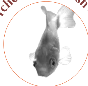
Tcherno « the fish »